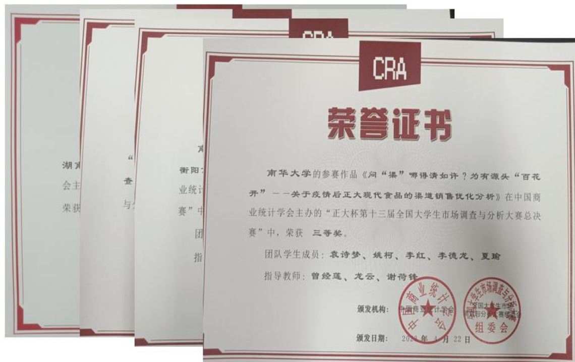
图3 本专业学生在全国大学生市场调查与分析大赛中获奖证书（部分）