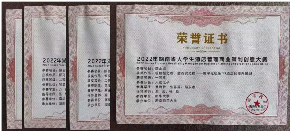
图4 本专业学生在2022年湖南省大学生酒店管理商业策划创新大赛中获奖证书（部分）