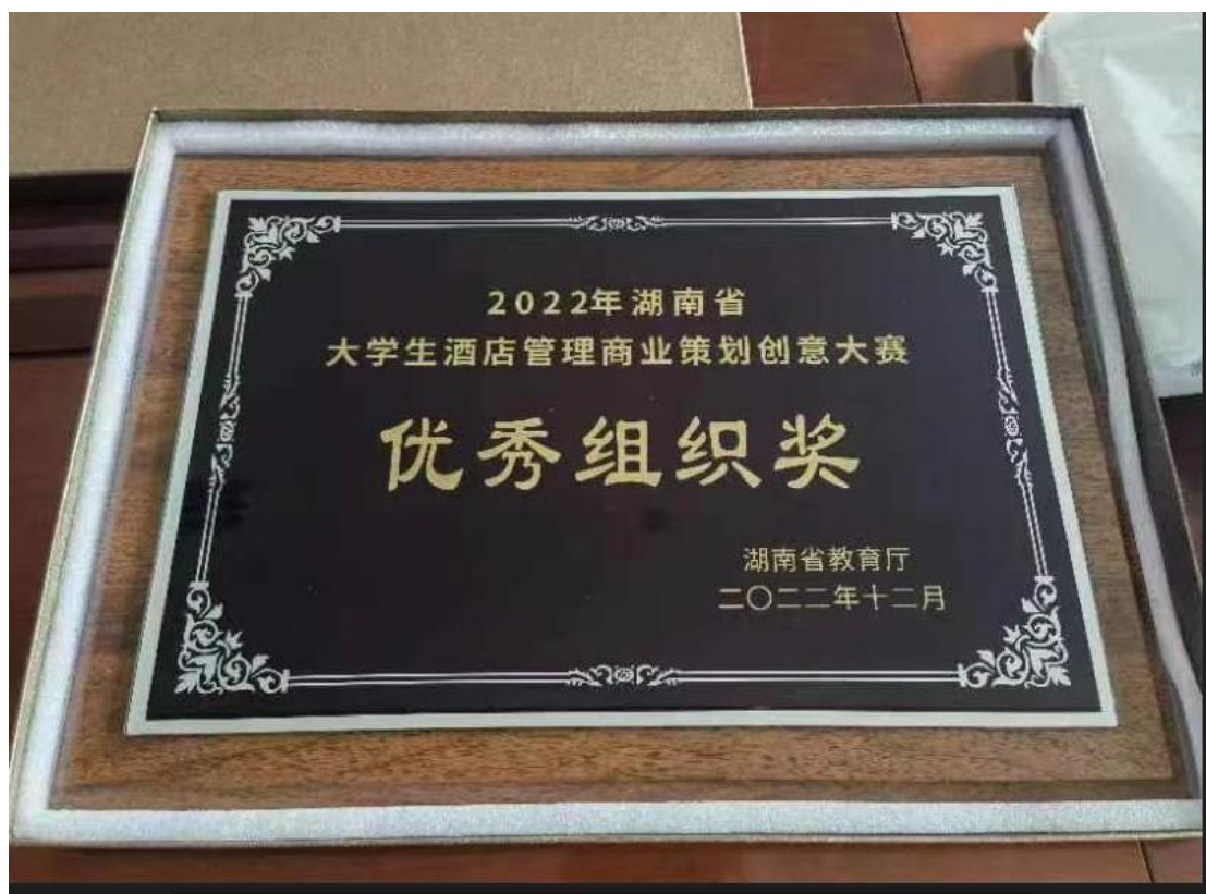
图 2 2022 年度湖南省大学生酒店管理商业策划创意大赛优秀组织奖

2021-2023 年期间，学生成功申报国家与省级大学生研究性学习与创新创业项目立项 4 项，累计发表科研论文超过 30 篇。学生积极参加大学生挑战杯大赛、全国大学生市场调查与分析大赛、湖南省企业经营模拟竞赛、湖南省大学生酒店管理商业策划创意大赛等比赛，并获奖超过 70 项，其中国家级奖 9 项。